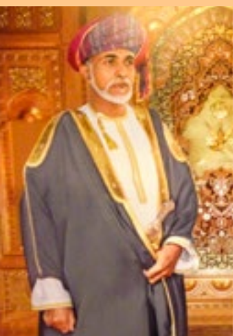
Qabus ibn Said (Staatsoberhaupt des Oman)